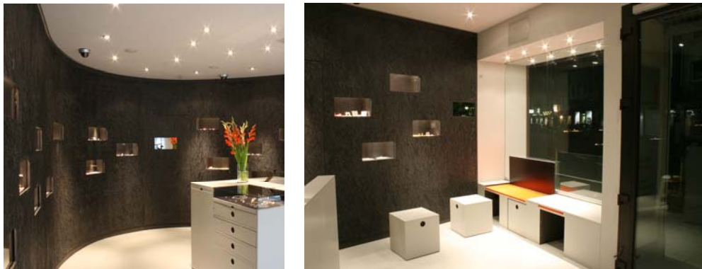
Galerie Gesamtmetall, Frankfurt 2008

Jede dieser Bestands-Flächen hat ihr ganz eigenes Profil, das genau betrachtet und neu vermarktet werden muss. Hierbei reicht die Bandbreite von der Kleinstfläche in Innenstadtlage für den hochwertigen Juwelier bis zur Großfläche im Industriegebiet mit zehntausenden Quadratmetern Verkaufsfläche für den Großmöbel-Diskounter.